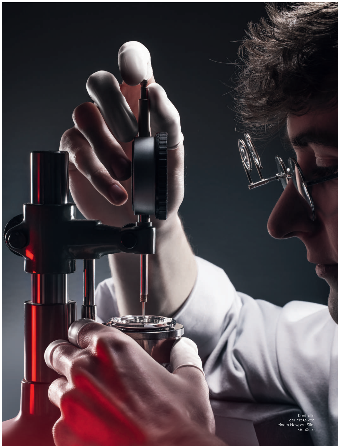
Kontrolle der Maße von einem Newport Slim Gehäuse