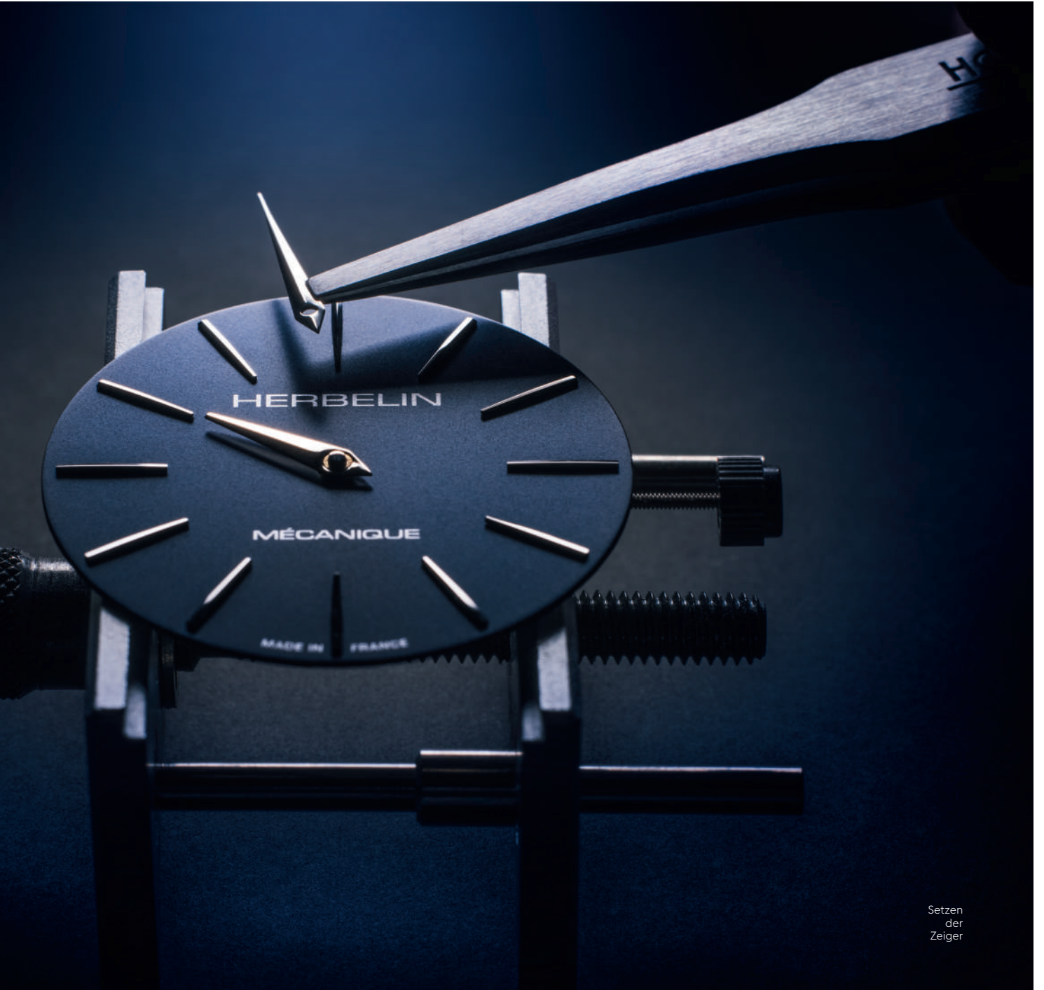
Setzen der Zeiger