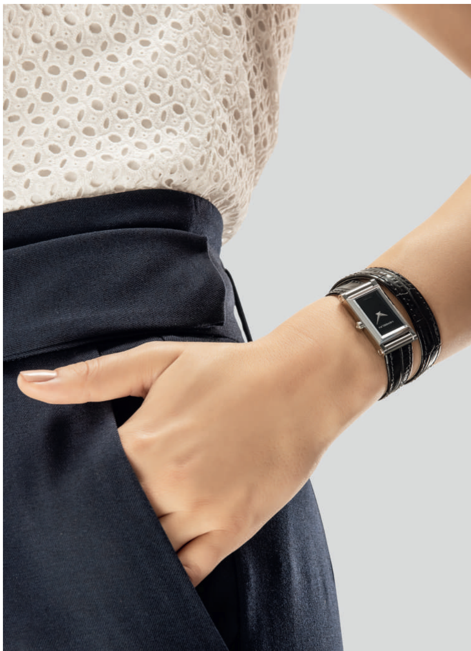
Antarès, austauschbare Bänder