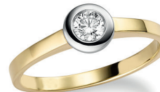
BRI 15. 0,25 ct.