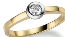
BRI 15. 0,15 ct.