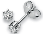
BOS07. 0,20 ct.