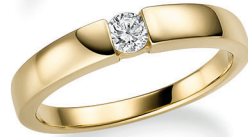
BRI06. 0,20 ct.