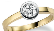
BRI 15. 0,50 ct.