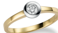
BRI 15. 0,20 ct.