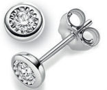
BOS 10. 0,15 ct.