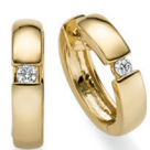
BOS08. 0,06 ct.