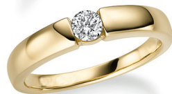
BRI06. 0,25 ct.