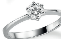
BRI 13. 0,50 ct.