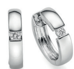
BOS09. 0,06 ct.