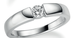
BRI07. 0,25 ct.