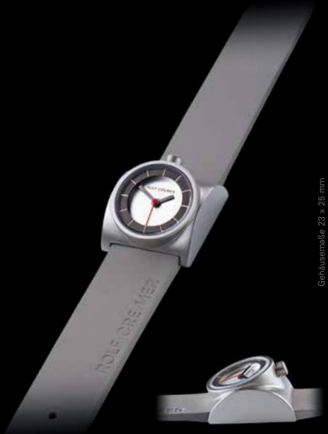
Gehäusemaße 23 x 25 mm