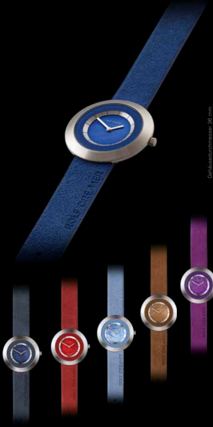
Gehäusedurchmesser 36 mm