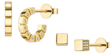
52 | 53