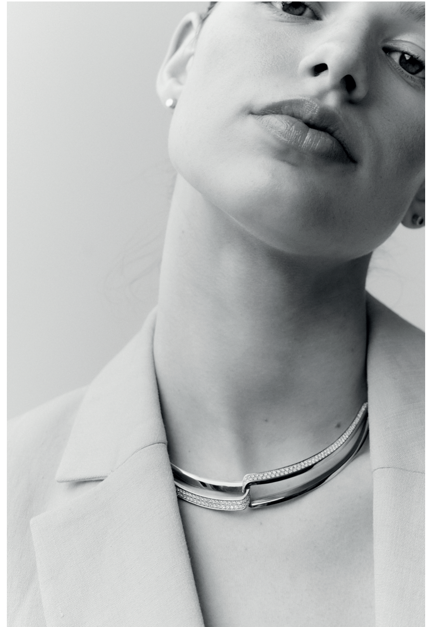
01 — Loop Necklace 750/- yellow gold w/ diamonds, 401221