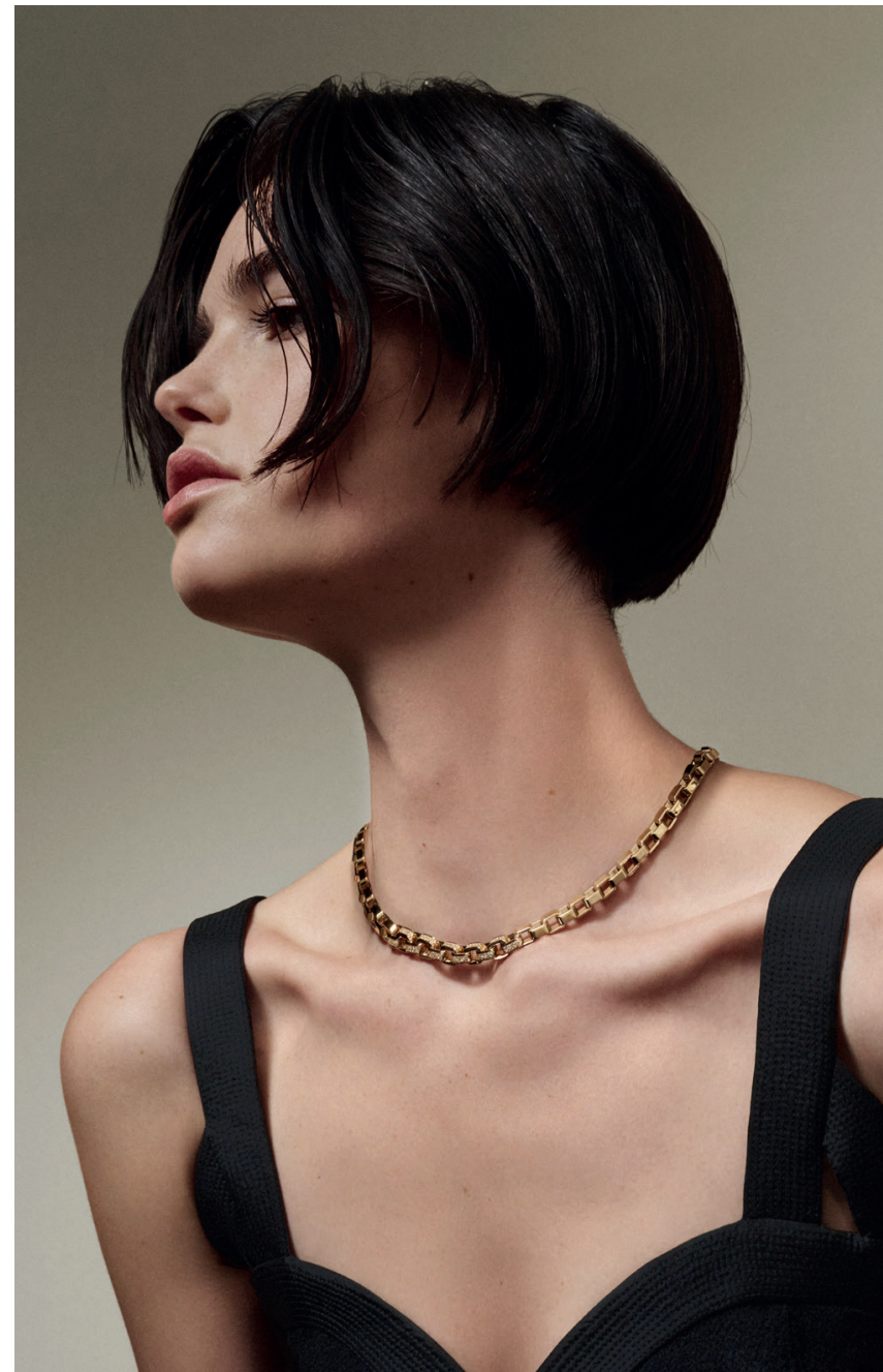
07 — P8 Necklace 750/- rose gold, 401224 | 08 — 750/- Trio Drop Earring rose gold, 401943