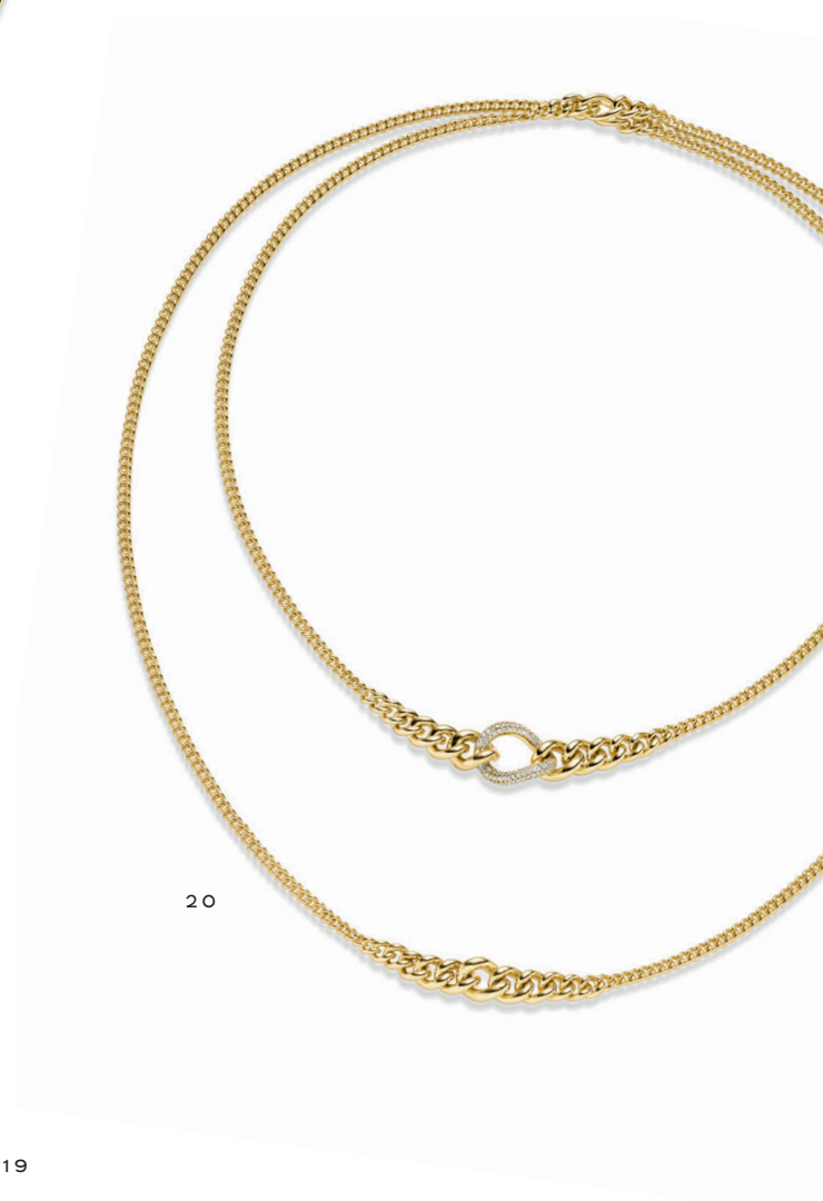
19 — Pendant Necklace 750/- yellow gold w/ diamonds, 401954