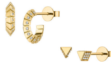
56 | 57