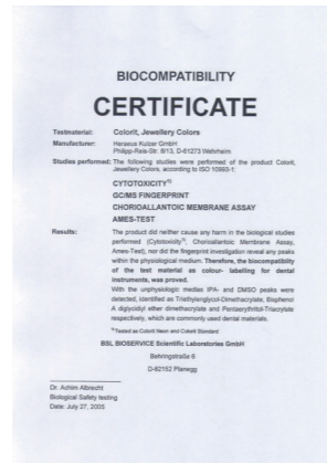
Zertifizierte Biokompatibilität Certified biocompatibility

is easy to work with, your imagination and love of experimentation will know no limits. The composite material with ceramic reinforcement can be applied quickly and easily, hardened permanently under blue light and ground and polished mechanically. The material is adhesion-, shock- and wear-resistant, making it ideal for high-quality and individual designs.