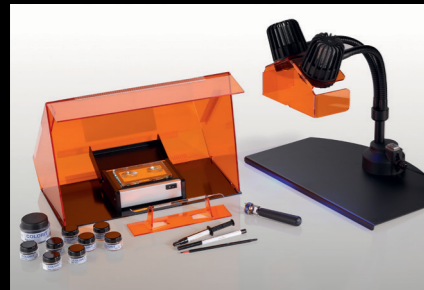
COLORIT® Set Desk Power DP2