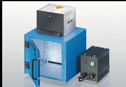
COLORIT® Light Cube