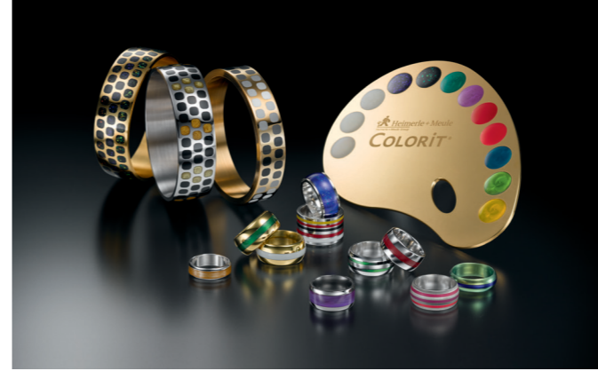
Mit COLORIT® ausgelegte Schmuckstücke Jewellery designed with COLORIT®