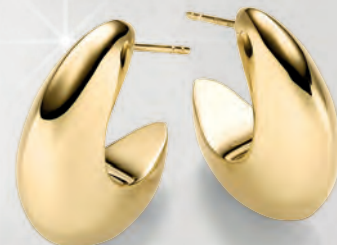
24-419 Creolen Silber 925/- 79,00