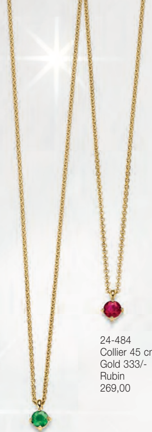
24-484 Collier 45 cm Gold 333/- Rubin 269,00