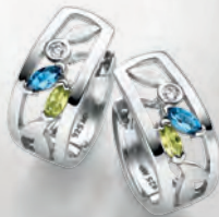
24-472 Creolen Silber 925/- Zirkonia*/Topas blau**/ Peridot 129,00