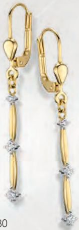
24-480 Ohrhänger Gold 333/- Zirkonia* 189,00