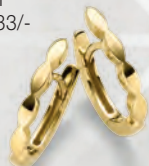
24-449 Creolen Gold 333/- 199,00