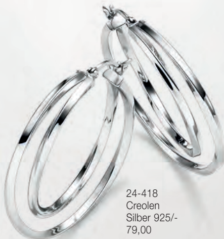
24-418 Creolen Silber 925/- 79,00