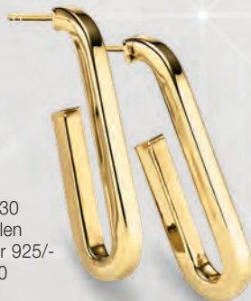
24-430 Creolen Silber 925/- 69,00