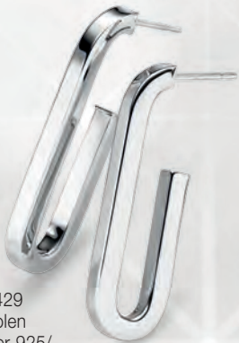
24-429 Creolen Silber 925/- 69,00