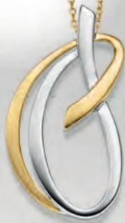
24-408 Anhänger o. Kette Silber 925/- 89,00