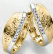
24-444 Creolen Gold 333/- Zirkonia*/ 339,00