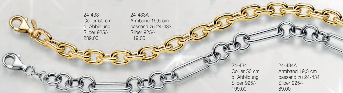
24-433A Armband 19,5 cm passend zu 24-433 Silber 925/- 119,00