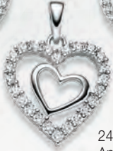
24-461 Anhängen Silber 925/- Zirkonia* 49,00