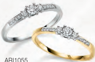
ARI1055 Ring Gold 585/- 11 Brillanten 0,19 ct. WSI 949,00