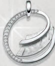
24-466 Anhängen Silber 925/- Zirkonia* 99,00