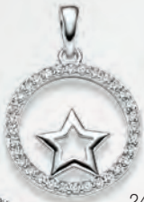
24-462 Anhängen Silber 925/- Zirkonia* 49,00