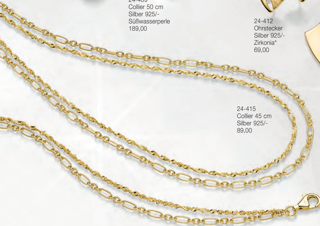
24-415 Collier 45 cm Silber 925/- 89,00