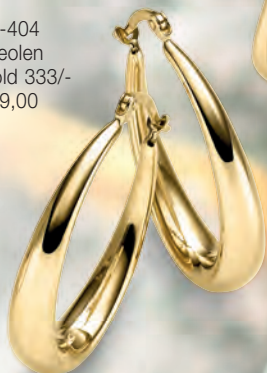
24-404 Creolen Gold 333/- 289,00