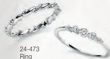
24-473 Ring Silber 925/- 29,00