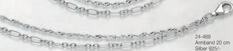
24-469 Armband 20 cm Silber 925/- 59,00