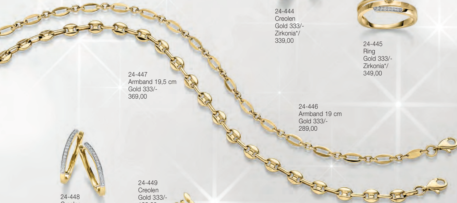
24-447 Armband 19,5 cm Gold 333/- 369,00