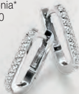
24-431 Creolen Silber 925/- Zirkonia* 49,00