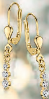
24-402 Ohrhänger Gold 333/- Zirkonia* 149,00