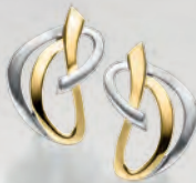
24-407 Ohrstecker Silber 925/- 65,00