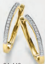
24-448 Creolen Gold 333/- Zirkonia* 349,00