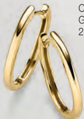
24-457 Creolen Gold 333/- 269,00