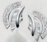
24-467 Ohrstecker Silber 925/- Zirkonia* 69,00