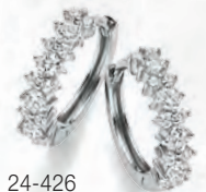
24-426 Creolen Silber 925/- Zirkonia* 55,00