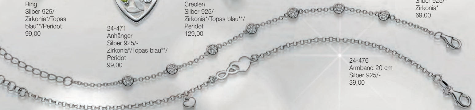
24-476 Armband 20 cm Silber 925/- 39,00