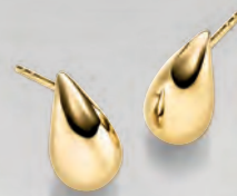
24-410 Ohrstecker Silber 925/- 79,00