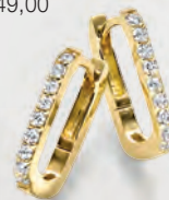
24-432 Creolen Silber 925/- Zirkonia* 49,00