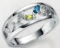
24-470 Ring Silber 925/- Zirkonia*/Topas blau**/Peridot 99,00