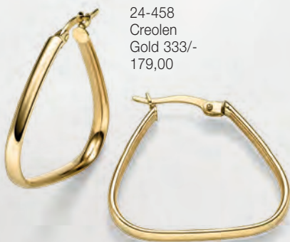
24-458 Creolen Gold 333/- 179,00