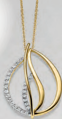
24-453 Anhänger o. Kette Gold 333/- Zirkonia* 319,00