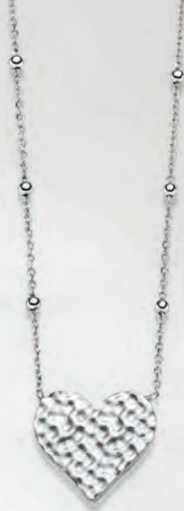
24-463 Collier 45 cm Silber 925/- 49,00