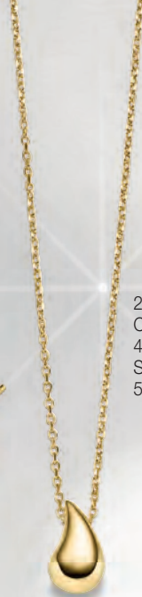
24-411 Collier 45 cm Silber 925/- 59,00