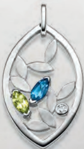
24-471 Anhängen Silber 925/- Zirkonia*/Topas blau**/ Peridot 99,00