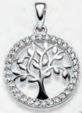
24-460 Anhängen Silber 925/- Zirkonia* 55,00