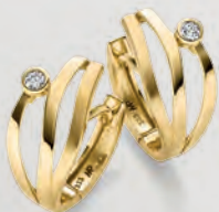
24-485 Creolen Gold 333/- Zirkonia* 289,00