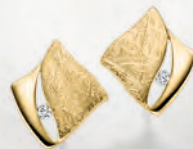
24-412 Ohrstecker Silber 925/- Zirkonia* 69,00