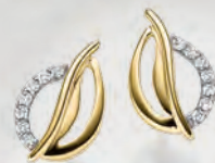
24-454 Ohrstecker Gold 333/- Zirkonia* 249,00