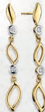
24-482 Ohrhänger Gold 333/- Zirkonia* 329,00