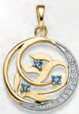
24-442 Anhänger Gold 333/- Zirkonia*/ Topas blau** 219,00