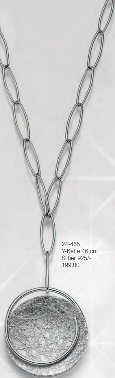
24-465 Y-Kette 46 cm Silber 925/- 199,00