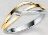
24-406 Ring Silber 925/- 69,00