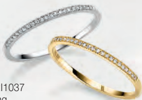
ARI1037 Ring Gold 585/- 23 Diamanten 0,06 ct. WSI 449,00