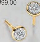
OS 183414 Ohrstecker Gold 585/- 14 Diamanten 0,07 ct. WPI 399,00