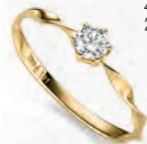
24-488 Ring Gold 333/- Zirkonia* 219,00