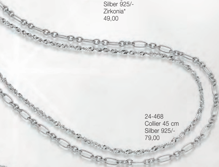
24-468 Collier 45 cm Silber 925/- 79,00