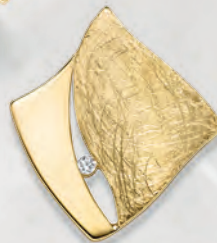
24-413 Anhänger Silber 925/- Zirkonia* 89,00