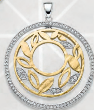
24-414 Anhänger Silber 925/- Zirkonia* 189,00