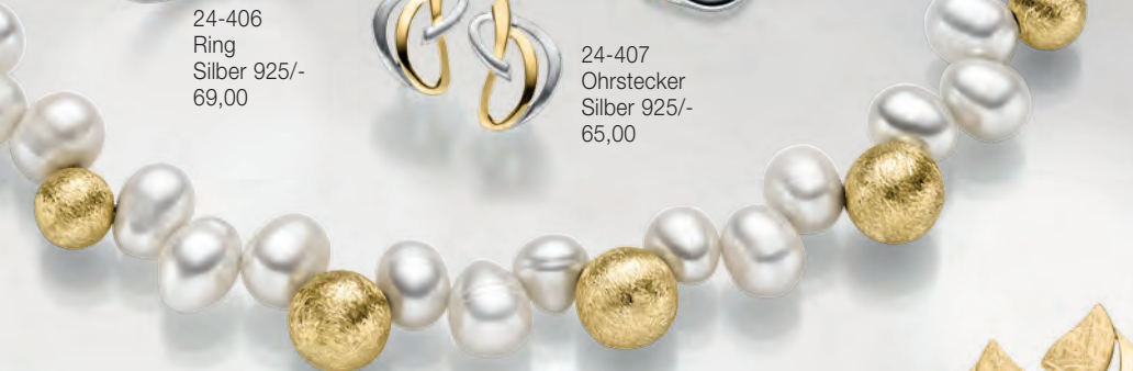
24-409 Collier 50 cm Silber 925/- Süßwasserperle 189,00