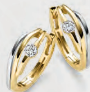
24-486 Creolen Gold 333/- Zirkonia* 229,00