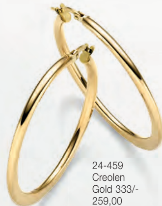
24-459 Creolen Gold 333/- 259,00