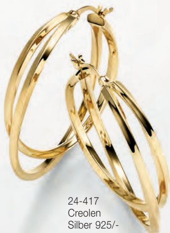
24-417 Creolen Silber 925/- 79,00