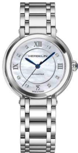
1630B59 GALET AUTOMATIC

Swiss Made Automatikuhwerk Sellita 11 ½ SW200-1 41 Stunden Gangreserve Edelstahl 316L Saphirglas - Wasserdicht bis 50 m Höhe: 9,55 mm Zifferblatt Perlmutter - Zirkonia. Faltschließe.