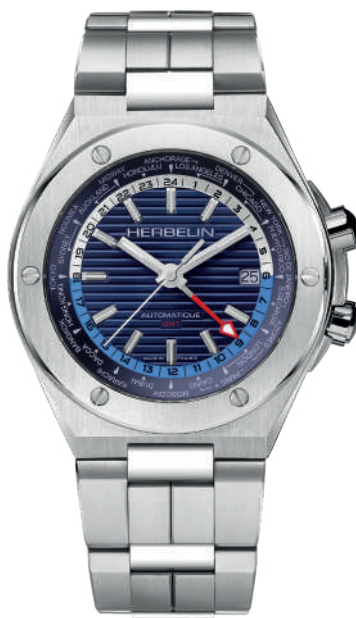
1445/B25 CAP CAMARAT GMT AUTOMATIC

Swiss Made GMT-Automatikuhrwerk Sellita SW330-2 56 Stunden Gangreserve Edelstahl 316 L Saphirglas - Wasserdicht bis 100 m Transparenter Gehäuseboden Höhe: 10,35 mm Faltschließe.