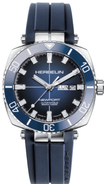
1774BL15CB NEWPORT DIVER AUTOMATIC

Swiss Made Automatikuhwerk Sellita 11 ½ SW220 41 Stunden Gangreserve Edelstahl 316 L Saphirglas - Wasserdicht bis 300 m Verschraubte Krone - Lünette aus Keramik Transparenter Gehäuseboden Höhe: 13,95 mm Faltschließe mit Tauchverlängerung Newport Elastomer FKM.