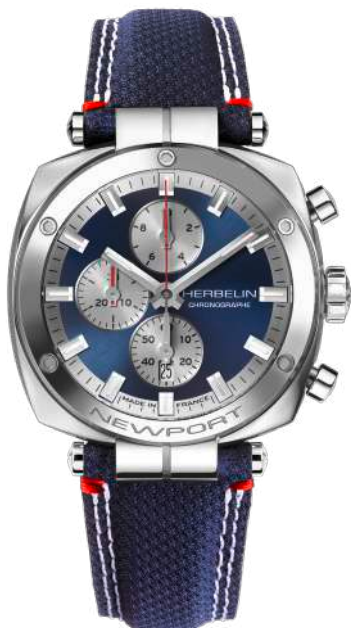
35664AP25 NEWPORT HÉRITAGE CHRONO

Schweizer Quarzwerk 10 ½ x 11 ½ Ronda 3540-D Edelstahl 316L Saphirglas - Wasserdicht bis 100 m Höhe: 12,50 mm Dornschließe Leder/High-Tech-Textil.