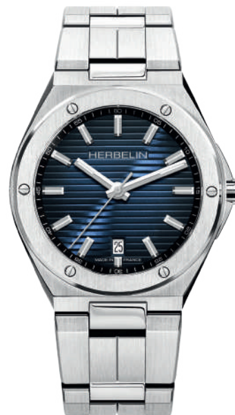
12245B15 CAP CAMARAT

Schweizer Quarzwerk 11 ½ Ronda 715 Edelstahl 316 L Saphirglas - Wasserdicht bis 100 m Höhe: 7,60 mm Faltschließe.