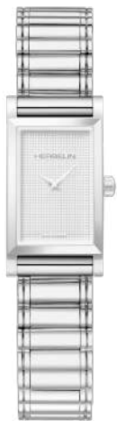
B17443AP2 ROLL BRACELET