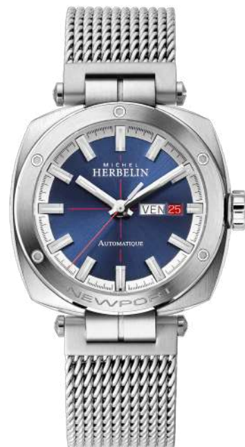
1764/42B NEWPORT HÉRITAGE AUTOMATIC

Swiss Made Automatikuhwerk Sellita 11 ½ SW220 41 Stunden Gangreserve Edelstahl 316 L Saphirglas - Wasserdicht bis 100 m Transparenter Gehäuseboden Höhe: 12,25 mm Faltschließe.