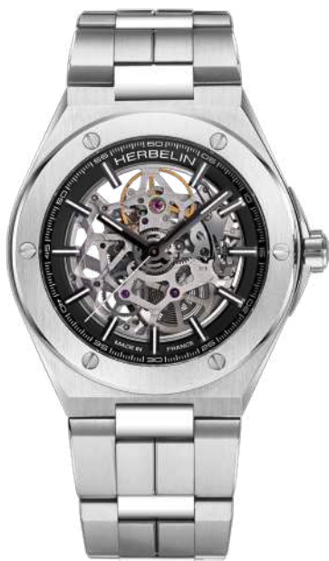
1845BSQ14 CAP CAMARAT SKELETON

Exklusives Swiss Made Automatikuhrwerk Sellita 13 ¼ SW400-1 41 Stunden Gangreserve Edelstahl 316 L Saphirglas - Wasserdicht bis 100 m Transparenter Gehäuseboden Höhe: 10,45 mm Faltschließe.