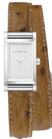
B17048.196 FAÇON AUTRUCHE GOLD