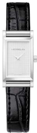
B17048.59 COCO VINTAGE NOIR